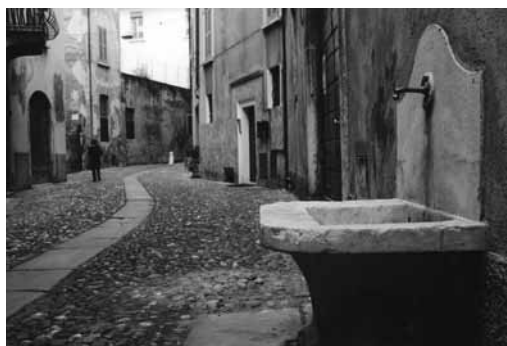
Foto del mese di Marzo 2012 AUTORE: Mino Dalbono "ANTICO VICOLO DI BRESCIA"