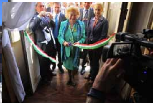
Reggia di Racconigi e taglio del nastro della principessa Elettra Marconi

La mostra rimarrà in esposizione fino al 28 Ottobre 2012.