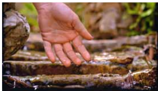
Foto del mese di Aprile 2012 "CHIARE, FRESCHE, DOLCI ACQUE"