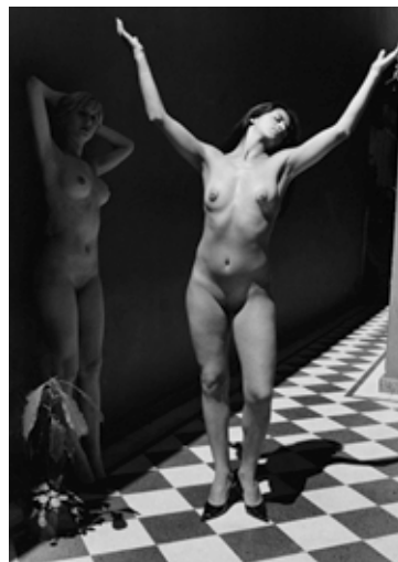
Homage to the Sun

La mostra verrà inaugurata nel nostro Museo - Sala Mostre e Conferenze il 29 Settembre 2012 e rimarrà in esposizione fino al 28 Ottobre 2012 .