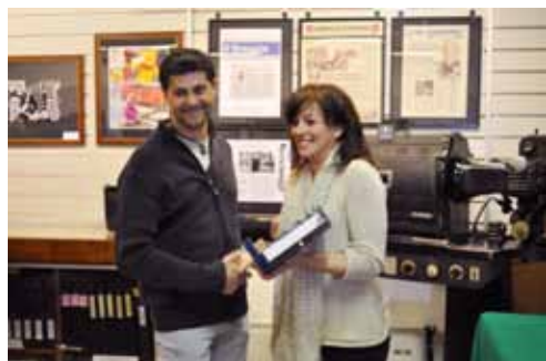
Primo Premio Roberto Marchi