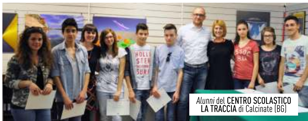
Alunni del CENTRO SCOLASTICO LA TRACCIA di Calcinate (BG)

ha avuto la possibilità di dare la propria lettura, la propria interpretazione, trasportando al loro interno il proprio mondo interiore.