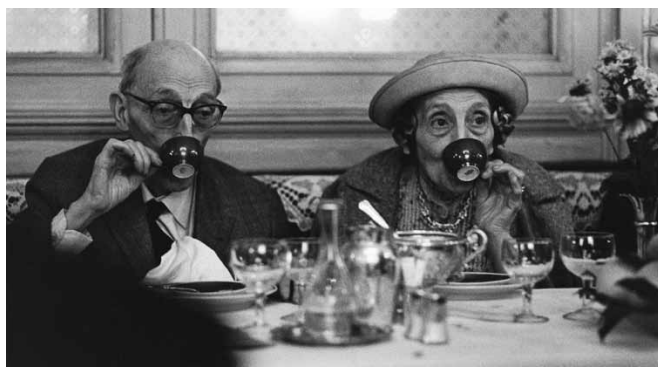
Caffè degli aristocratici (Torino 1968)

MIAMI (1950) a CAINO E ABELE (ELIOCHI-MIGRAMMA 2005) una nota particolare merita l'aprezatissimo scatto IL CAFFÈ' DEGLI ARISTOCRATICI (TORINO 1968).