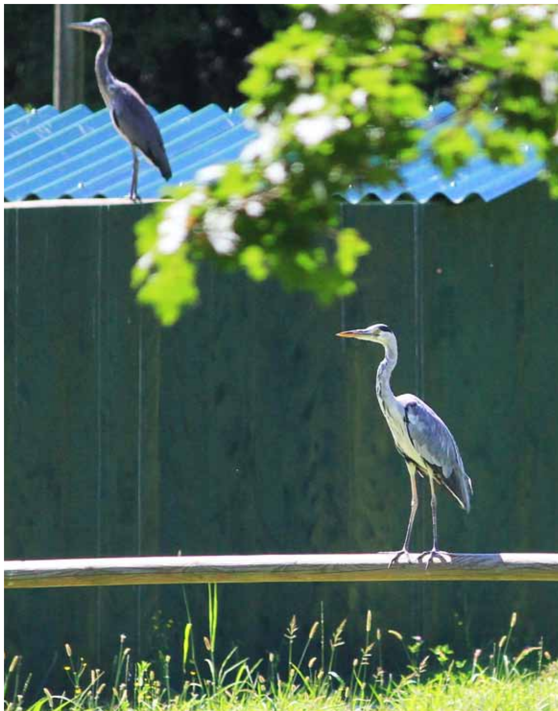
Coppia di airone cenerino