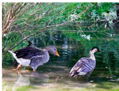
Oca dalla faccia bianca