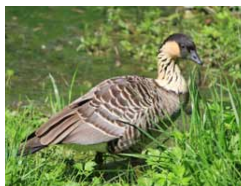
Oca delle Haawai